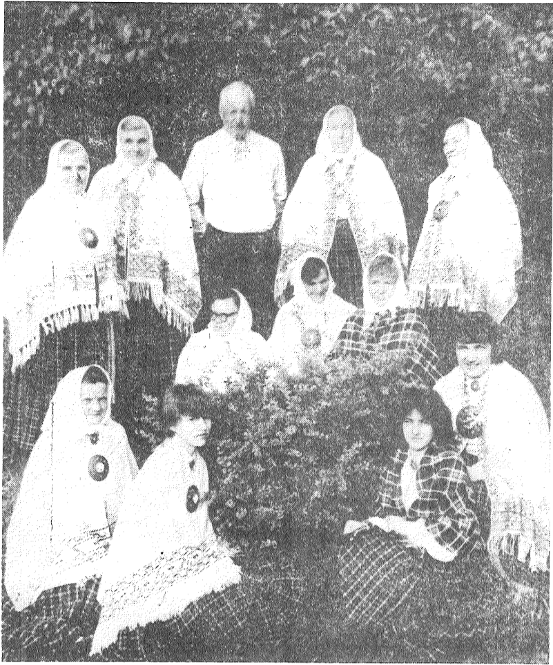
SAUNAS ETNOGRĀFISKAIS ANSAMBLIS.