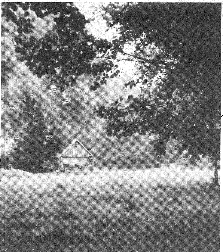
Latgales lauku pirtīņa.