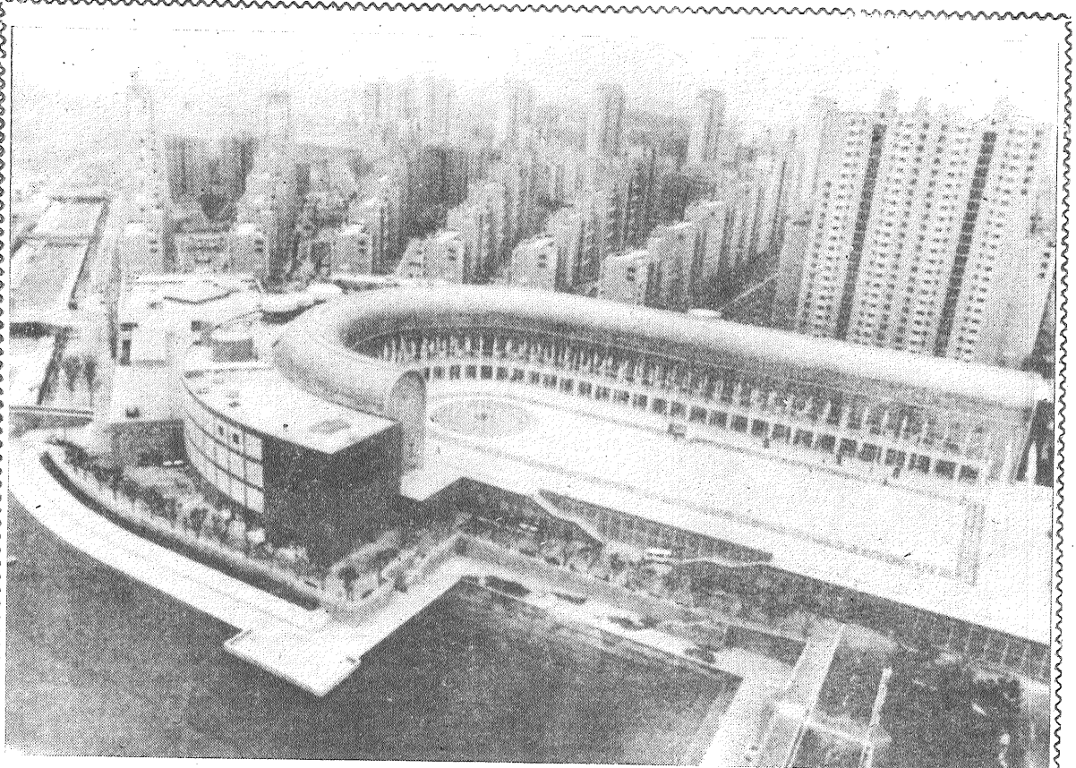
SEULA. Tāds izskatās olimpiskais ciemats (priekšplānā), kurā dzīvos sportisti un arī preses AP—TASS telefoto pārstāvji.