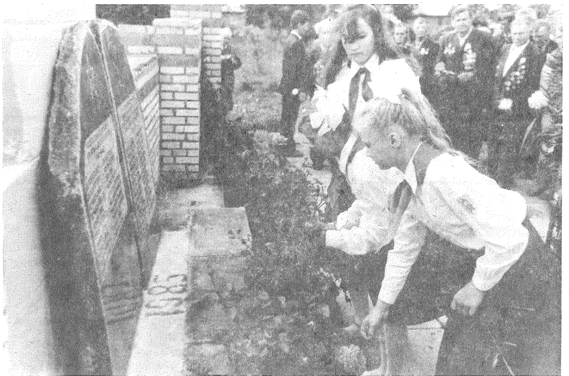
● Tikšanās dalībnieki noliek ziedus piemiņas vieta pie Rudzētu vidusskolas.