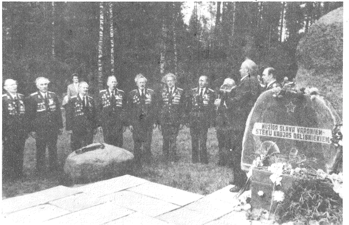
● Steķu silā skanēja 130. latviešu strēlnieku korpusa veterānu ansambļa dziedātās dziesmas.