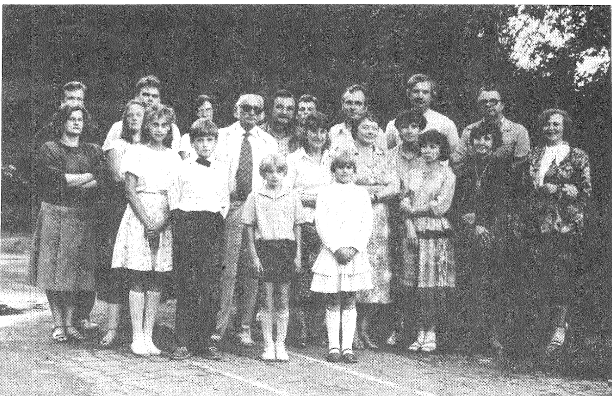
● Radošās mākslinieku grupas «Lēdurga — 88» pārstāvji kopā ar ansambļa «Via tertia» dalībniekiem.