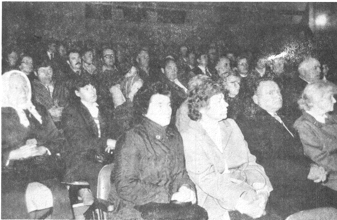
● ATTELĀ: Latvijas Tautas frontes Preiļu nodaļas konference aizvadītā sestdienā kinoteātrī «Ezerzeme» pulcēja daudzus desmitus cilvēku. Tas uzskatāmi apliecināja, ka arī mūsu rajona iedzīvotāji atsaucīgi uzņem Tautas frontes idejas, grib līdz darboties un tādejādi sekmēt mūsu sabiedrības pārbūves procesu.

Aicinām pieteikties ekonomistus, juristus, sanitāri epidemioloģiskās stacijas darbiniekus, tāpat — tos rajona iedzīvotājus, kas, izveidojot kompetentu ekspertu komisiju, spētu apkopot programmas projektu, kā arī visus izteiktos priekšlikumus un izveidot reālu un izpildāmu, juridiski, ekonomiski un ekoloģiski pamatotu LTF Preiļu rajona nodaļas darbības programmu.