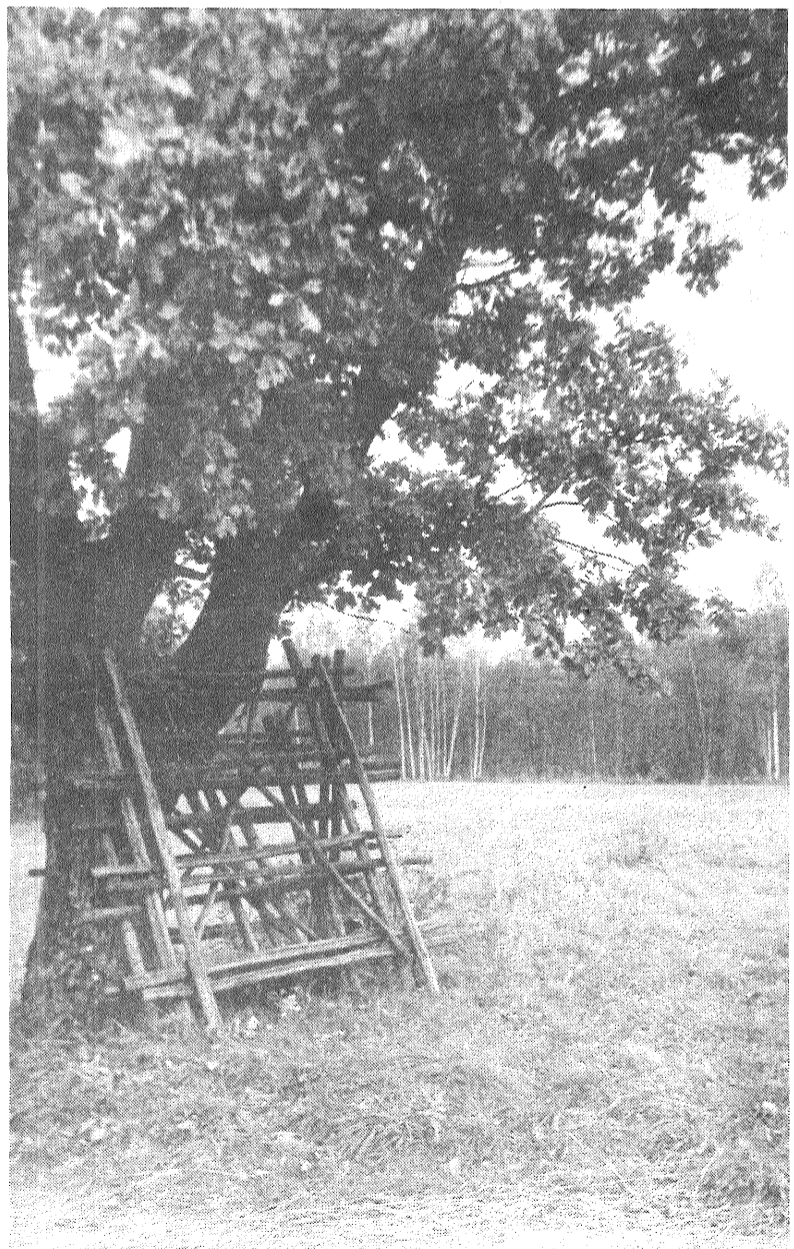
● Atvasaras motīvs.