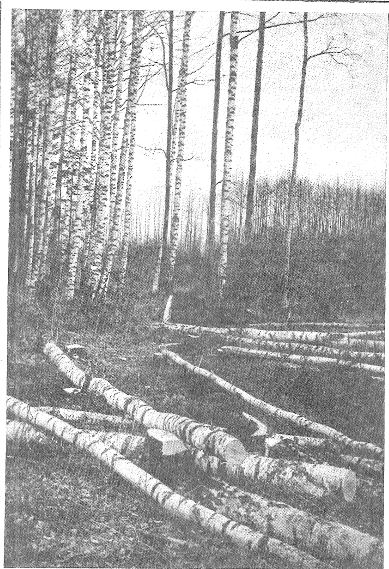
● Meža cirsmā.