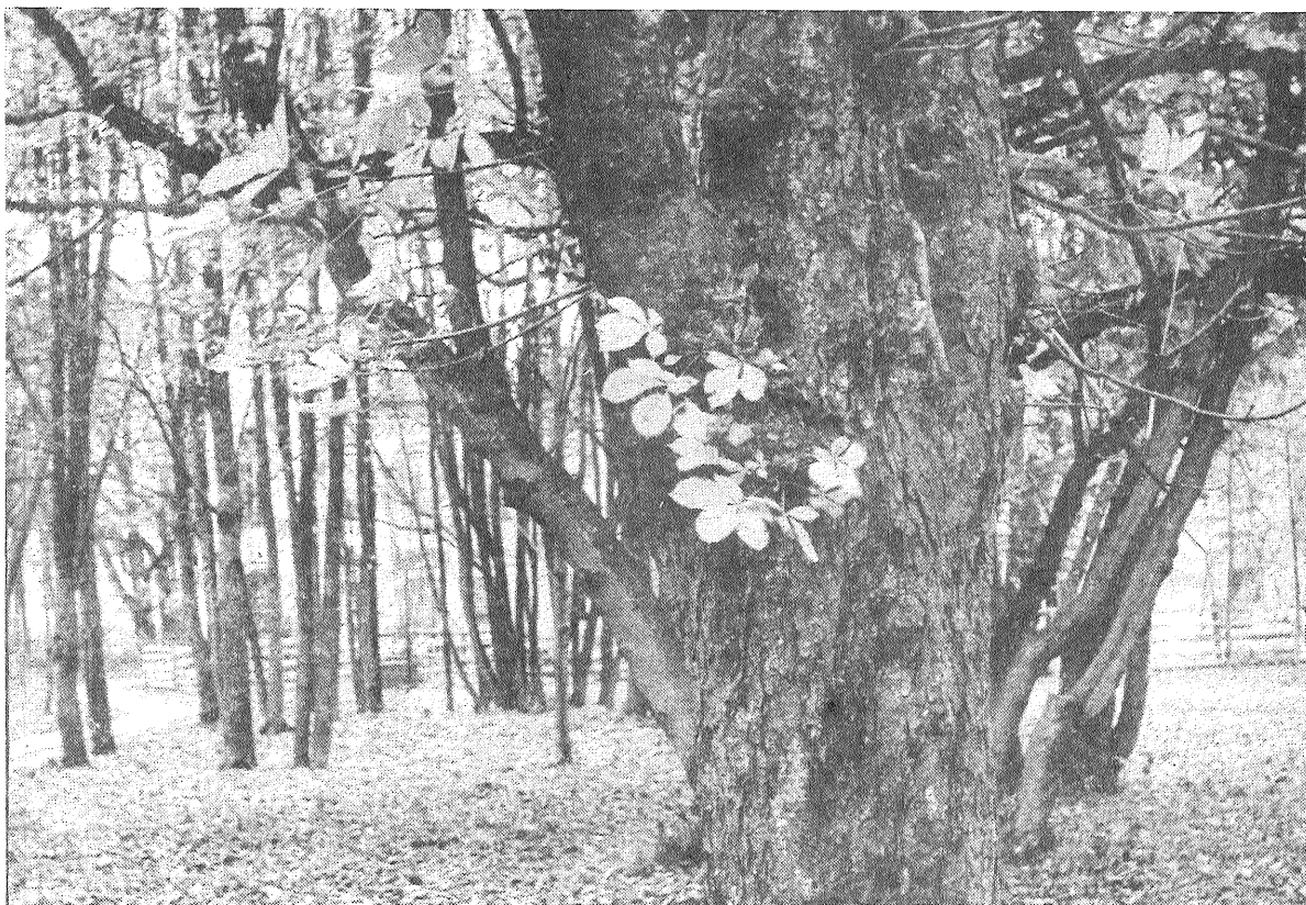
● Lapkritis Preiļu parkā.

Tuvojas noslēgumam parakstīšanās uz laikrakstiem un žurnāliem 1989. gadam. Neaizmirstiet nākamajam gadam pasūtīt rajona laikrakstu «Leņina Karogs»! Parakstīties uz mūsu avīzi jūs varat visās sakaru nodaļās, kā arī pie sabiedriskajiem preses izplatītājiem.