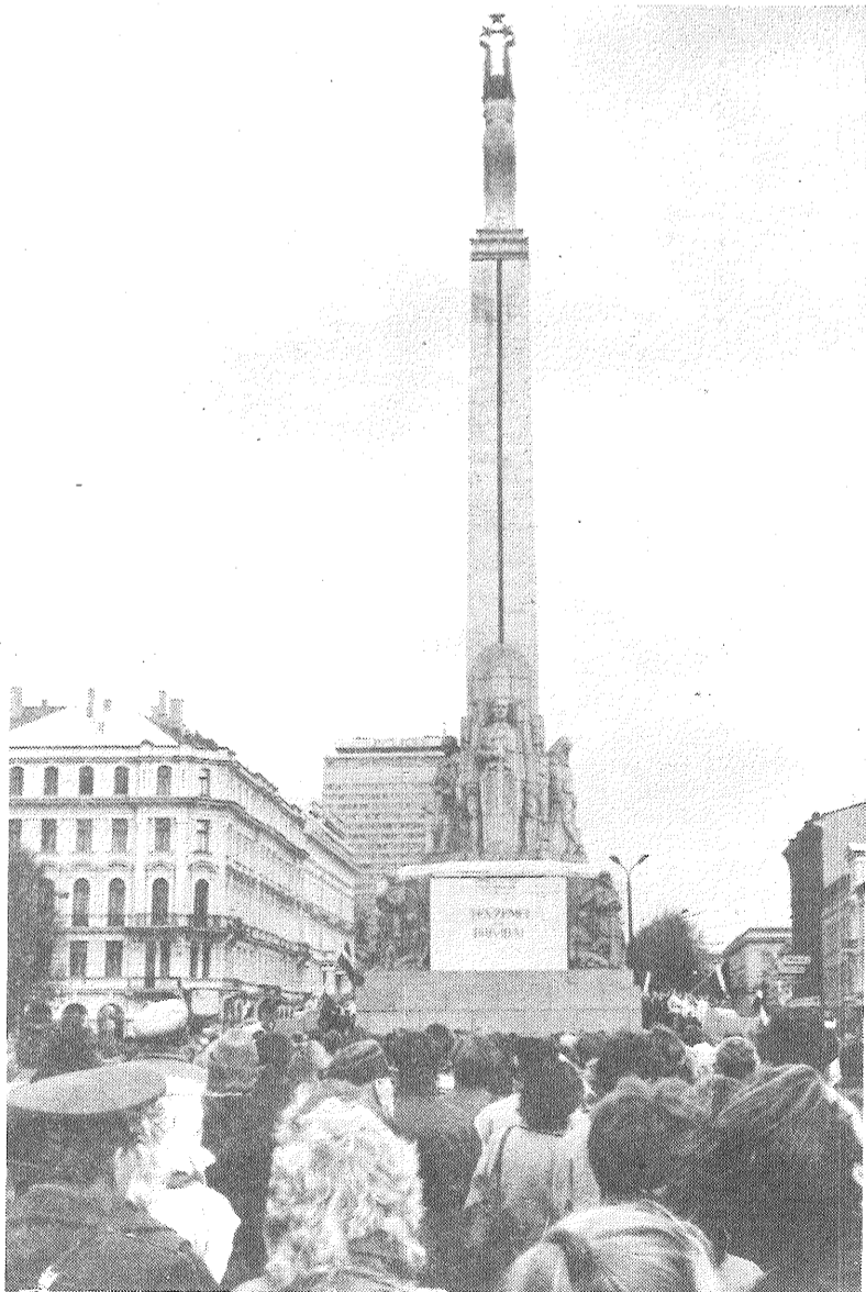
AUTORA fotoreprodukcija un foto

monumentālists Kārlis Zāle; tūkstošiem rīdzinieku un lauku darbaļaužu 1988. gada 28. oktobrī pulcējās pie Brīvības pieminekļa, lai godinātu tautas izcilā mākslinieka Kārļa Zāles piemiņu.