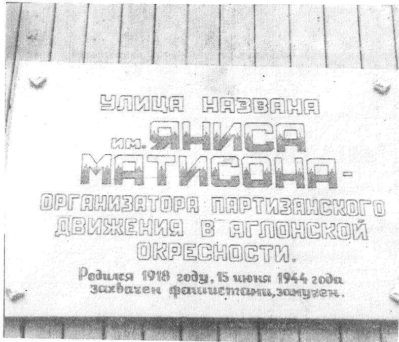
Tāds nosaukums ir ielai Aglonā.

Atsevišķā latviešu partizānu vienība tika noformēta 1942. gada novembrī Maskavas tuvumā, tajā ietilpinot septiņas partizānu organizatoru un vienu komjaunatnes darbinieku grupu, ko transporta lidmašīnu trūkuma