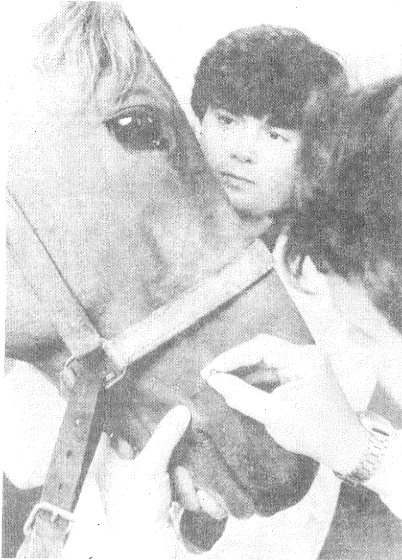
Cehoslovākijas medicīnas praksē aizvien aktīvāk izmanto seno austrumu dziednieku mākslu — adatu terapiju. Šo metodi sekmīgi

pielieto ne tikai cilvēku, bet arī dzīvnieku ārstēšanā. ATTEĻA: pieņemšana pie ārsta.