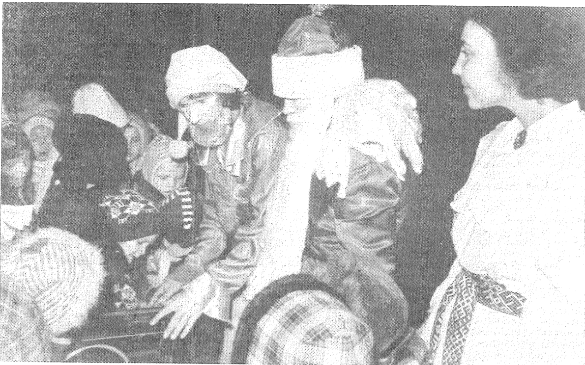
3. janvārī Preiļu kinoteātrī «Ezerzeme» notika kinofestivāls «Pasaka». Lai gan ne vietējās, ne ārzemju kinozaigznes pa piesni-

gušo un apledojušo ceļu atbraukt nevarēja, taču pie bērniem bija ieradusies ne mazāk gaidīti un mīļi ciemiņi — Sniegbaltīte, Salatētis un Mežarūķis.