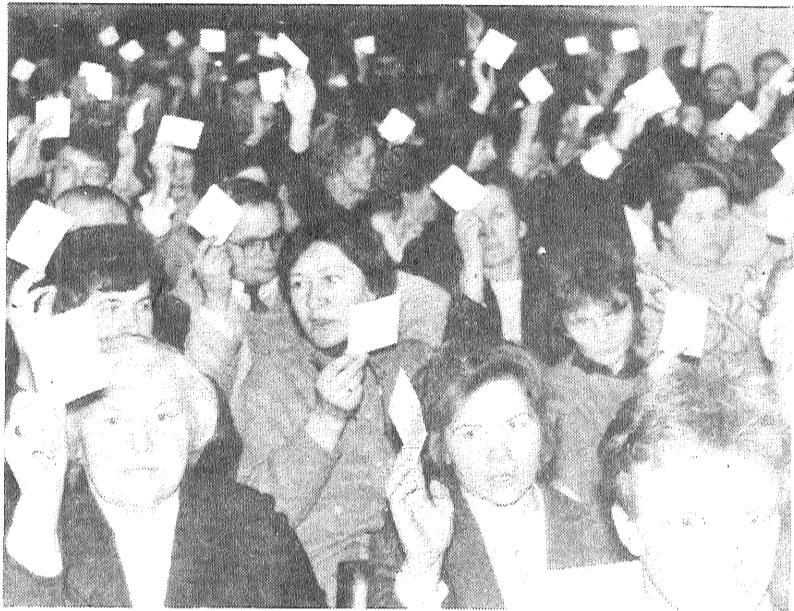
Balso priekšvēlēšanu sapulces dalībnieki.