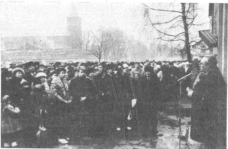
● Mītiņa laikā pie grāmatu nama «Latgale».