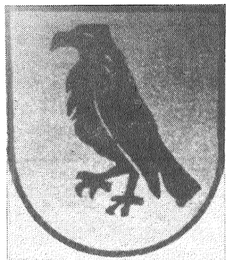
● Preiļu gerbonis