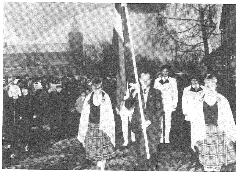
● Cauri pilsētas centram — uz mītiņa vietu...