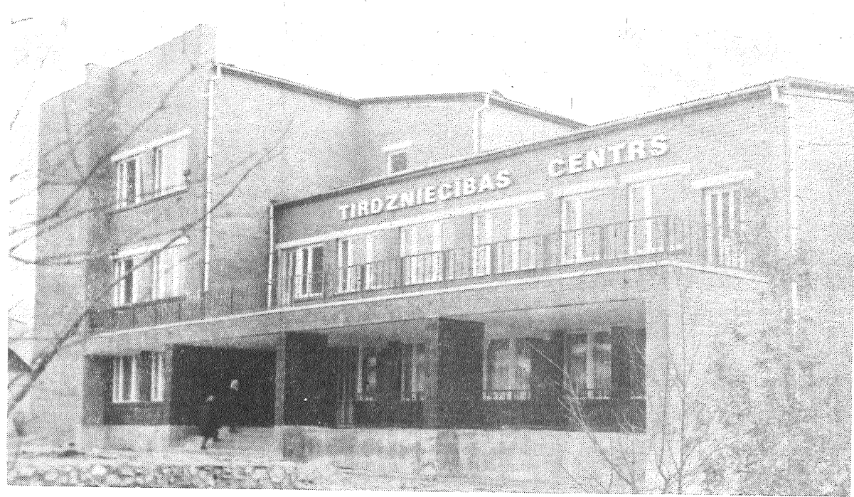
Agrofīrmas «Sarkanais Oktobris» Riebiņu ciematā durvis vēris liels tirdzniecības centrs (attēlā). Tam ir trīs stāvi, plašas un gaissas telpas.