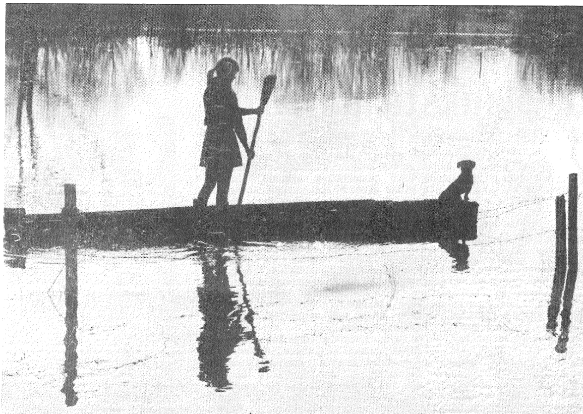
● Pavasarī, klusā Dubnas līcī...