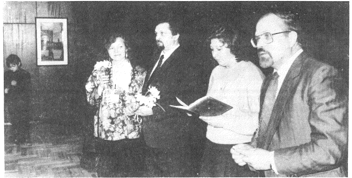
Šajās dienās Līvānos uz afišām parādījās noslēpumaini burti MD. Atšifrējums vēstīja, ka pilsētā sākas Mākslas dienas.