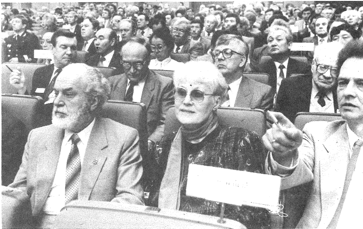
Maskava, Kremla Kongresu pils. PSRS Tautas deputātu kongress. ATTELĀ: delegāti no Latvijas PSR.

Iepriecinoši, ka šādi galēji izteikumi var skanēt mūsu kongresā, tas jau pats par sevi atspēko cienījamā zinātnieka tēzi, ka šeit pastāv agresīvs vairākums. Drīzāk — mazākums. Un dieva