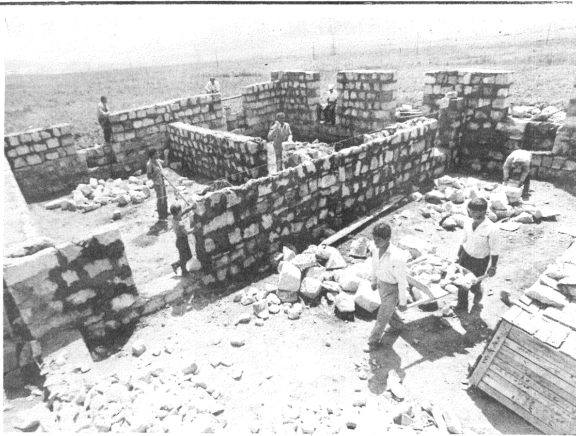
ARMENIJAS PSR. Gučarkas rajona Marqavitas ciemā zemestrīcē cieta visas 1050 mājas. Taču iedzīvotāju skaits te nesamazinājās — praktiski visas ģimenes Marqavitā palika ierastajā vietā, nolēma iekopt dzimtajā ciemā jaunu saimniecību. Ciema ļaužu migrāciju no dabas katastrofas zonas novērsa noma. Vietējā padomju saimniecība uz līguma pamata nodeva zemniekiem lietošanā zemi — vairāk nekā 500 hektārus kartupeļu, lopbarības sakņaugu lauku, lopkopības fermas, piešķīra teritoriju jaunu dzīvokļu celtniecībai.

E. AKSJONOVA, nepilngadīgo lietu inspekcijas inspektore, milicijas majore