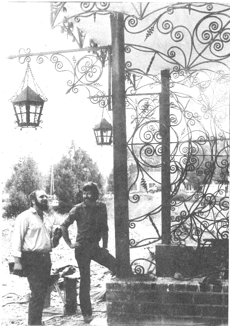
BALTKRIEVIJAS PSR. Pa pusei aizmirsto metālkalšanas mākslu nolēma atjaunot kooperatīva «Dekors» locekļi no Vitebskas apgabala Glubokojas.

biļetena «Moras Zeme» redakļģijas loceklis