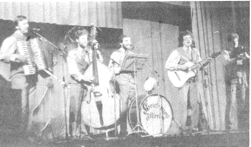
Dzied «Kreiburgas zikeri».