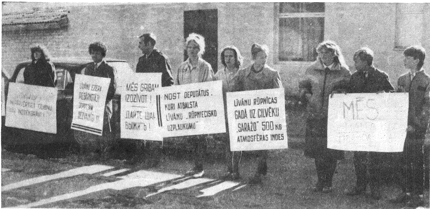
● ATTEĻĀ: 5. oktobrī Līvānos, piketā «Mēs gribam izdzīvot».