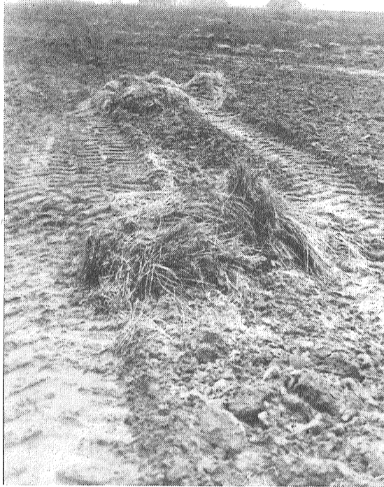
ATTELOS: jau minētais arums ar līniem, līnsēkļu zārdi un minerālmēslu noliktava.