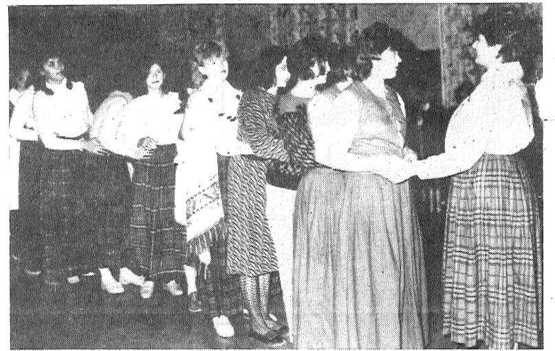
Redaktors P. PIZELIS