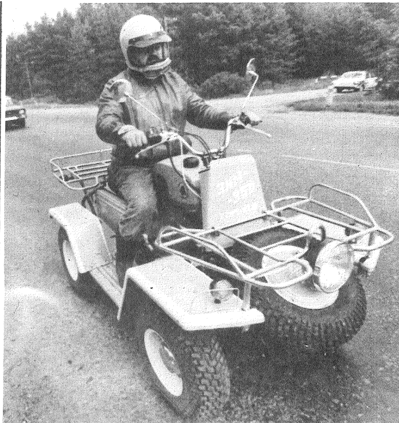
UKRAINAS PSR. Harkovas transporta mašīnbūves rūpnīca, kurai piešķirts Maļiševas vārds, radījis traktorā ar labām pārejām spējām, kam ir astoņi pārvadi un 350 kubikcentimetru liels dzinējs. Uz asfaltēta ceļa tas ļauj sasniegt ātrumu līdz 60 kilometriem stundā, bet bezceļa apstākļos pārvadā kravu līdz 300 kilogramiem.

Pēc patlaban noteiktās kārtības Preiļu rajonā uzņēmumiem un organizācijām ir jāatlīdzina saviem darbiniekiem izdarītie