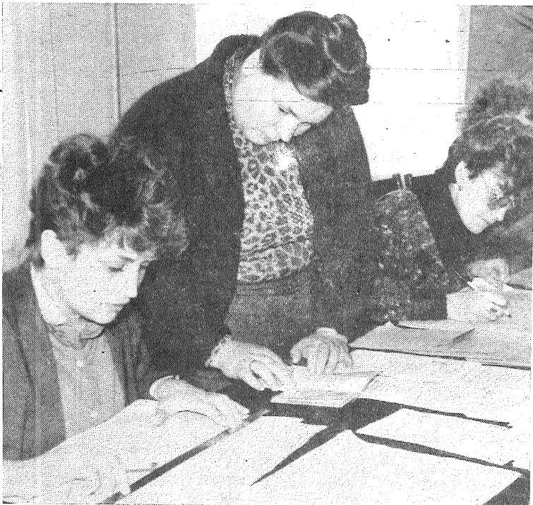
Vēlēšanu diena Preiļu 16. iecirknī.