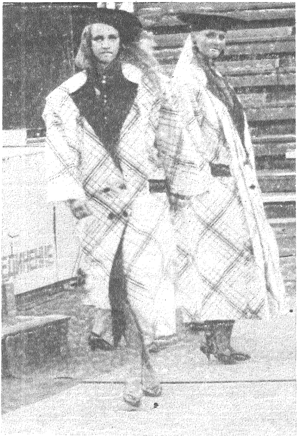
Atpūtas dienas foto