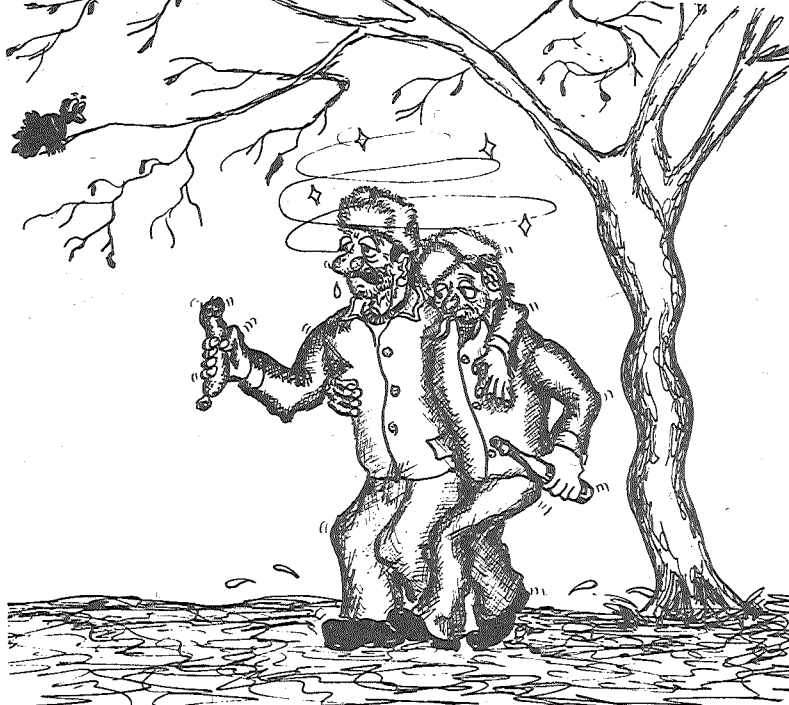
Рисунок Гунара Вилцана.