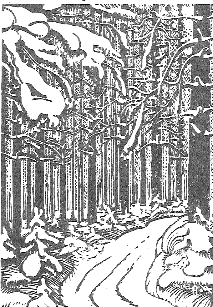
В ЗАСНЕЖЕННОМ ЛЕСУ. ЛИНОГРАВЮРА НИКОЛАЯ ГОРКИНА

Сам зайчишка серенький проложил ее. Никому не дано знать, под какой елочкой он бежит чочевать. По полям гуляют ветры, здесь — кругом тишь да благодать. Не пойдем по той тропинке, пусть зайчишка спит. И не будем тревожить: С перепугу серенький невесту куда уберит.