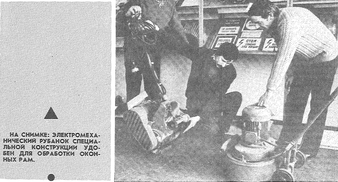
НА СНИМКЕ: ЭЛЕКТРОМЕХАНИЧЕСКИЙ РУБАНОК СПЕЦИАЛЬНОЙ КОНСТРУКЦИИ УДОБЕН ДЛЯ ОБРАБОТКИ ОКОННЫХ РАМ.