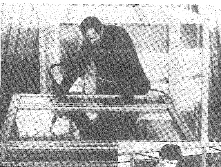
НА СНИМКЕ: МОЛОДЫЕ СТРОИТЕЛИ ИНТЕРЕСУЮТСЯ СРЕДСТВАМИ «МАЛОЙ МЕХАНИЗАЦИИ» И ПРИМЕНЕНИЕМ ИХ НА ПРАКТИКЕ.