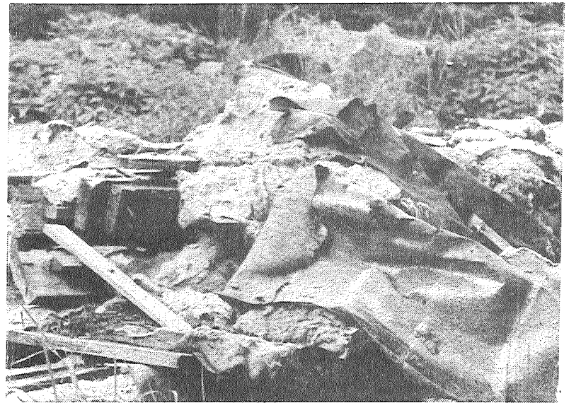
«Наши сердечки скука берет, Глазик Костяной, ты нам не поможешь! Ферму, вон, старую в Калнацких разрыли. Лес наш зарыли — фью, цо-цо-цо!»

Соловьи отвечают: «Ты из чащи-ка выглянь, дружок, Выйди на этот лужок, В чащу с хламом ведь не залезть-то, Фью — у, фью — у, фью, цо-цо-цо-цо.» Вышел. И сразу же рванул назад: наткнулся на кучу строймусора в перемешку со стекловатой и страшными предметами неопределяемого происхождения. Наткнулся на что-то другое. Перепугался, аж жуть: на самом верху виднелись сапоги. «Вот те на», —