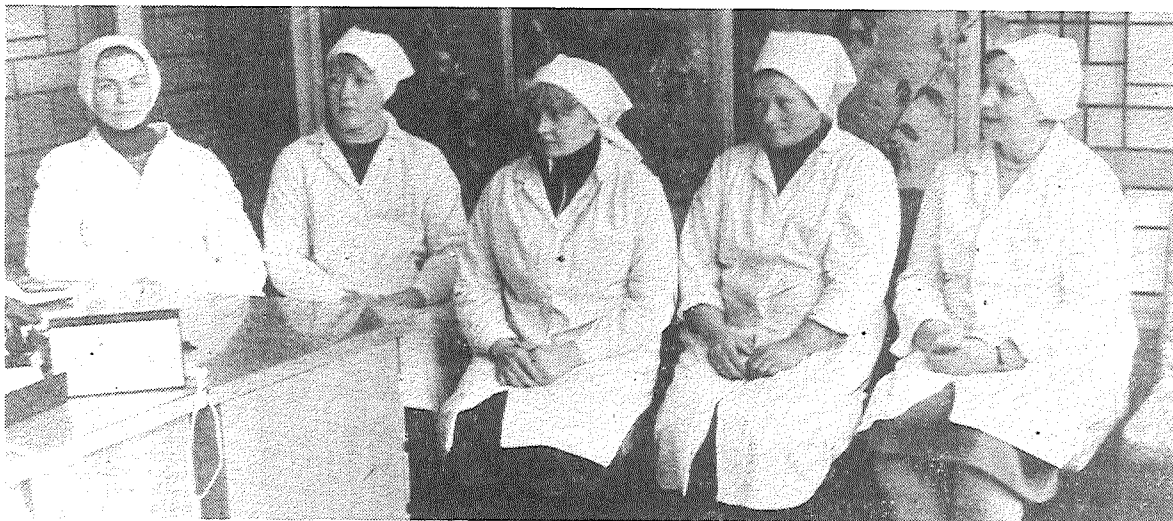
НА СНИМКЕ: группа рабочих приемки молока и выработки масла — эти участки объединены в один цех.