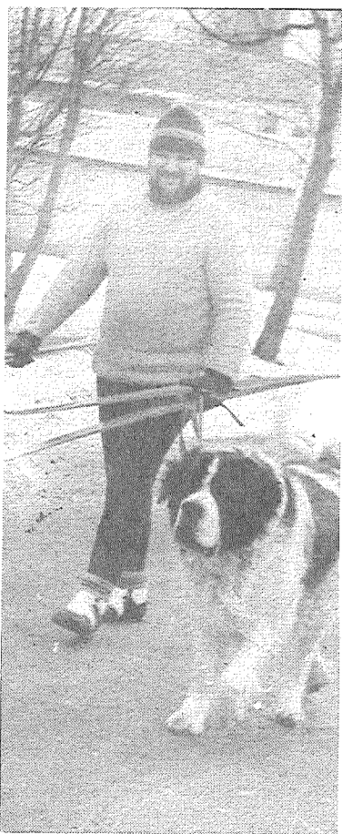
На прогулку.