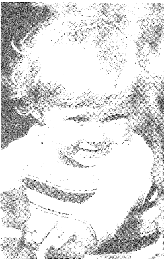
НАТАШЕНЬКА. Фотоэтиюд Вячеслава Степанова.

10-15. Вы практически не помогаете вести жене домашнее хозяйство. Держите себя не как любящий муж, а как клиент фирмы бытовых услуг под названием «Супруга».