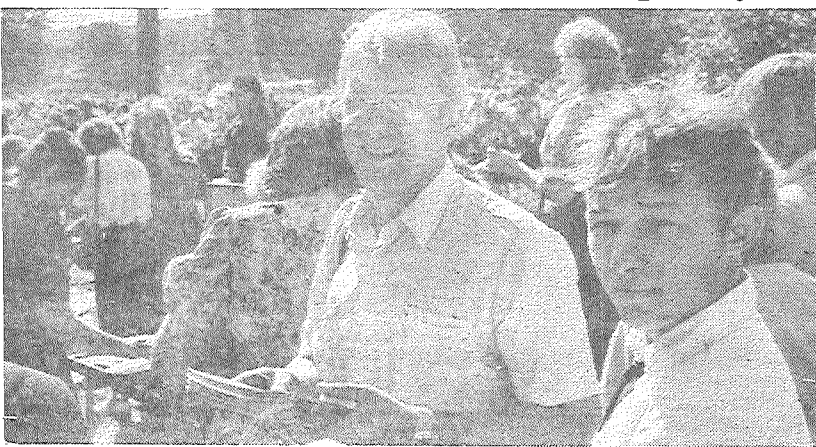
Недавно в Резекненском районе «Колнасаца», где стоял развалившийся дом семьи известного деятеля культуры Латгалии Ф. Трасуна, открыт памятный крест. НА СНИМКЕ: сбор средств на реставрацию дома Ф. Трасуна ведется с лета.