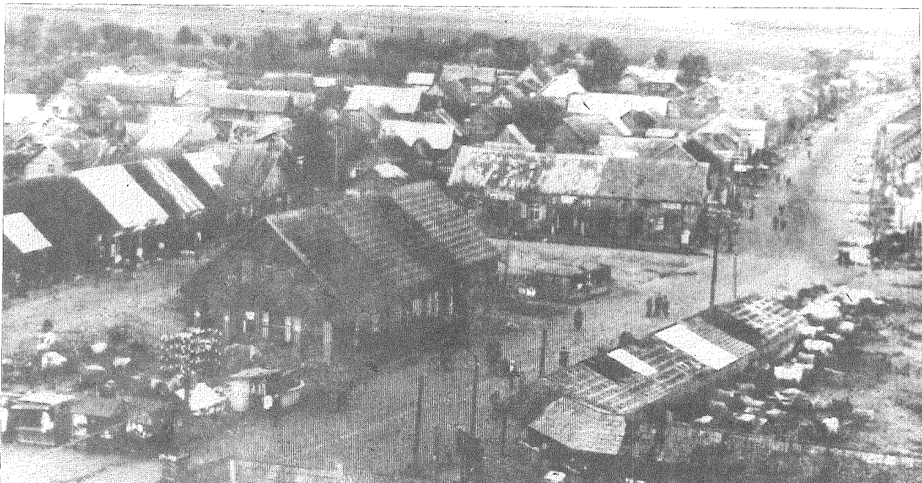
Центр г. Прейли 40 лет тому назад.

Ноябрь наш народ посвящает памяти душ усопших.