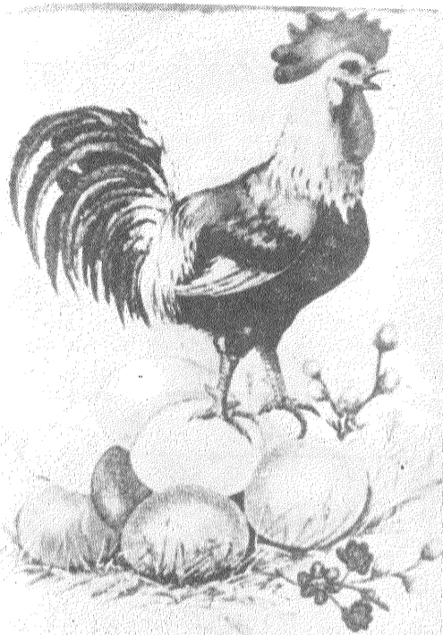
Prēcīgus Lieldienas svētkus!

LIELDIENAS ir pavasara saulgriežu svinības. Tās lezimē pavasara ekliptikas punktu, kad Zemes un Saules savstarpējā stāvokļa rezultātā diena un nakts ir vienādā garumā. Šādu pilnīgu gaismas uzvaru pār tumsu un Saules atmodu senās āriešu tautas atzīmējušas ar pavasara saulgriežu svinībām. Latviešiem tās ir Lieldienas, kur pats vārds izteic šī notikuma jēgu un saturu.