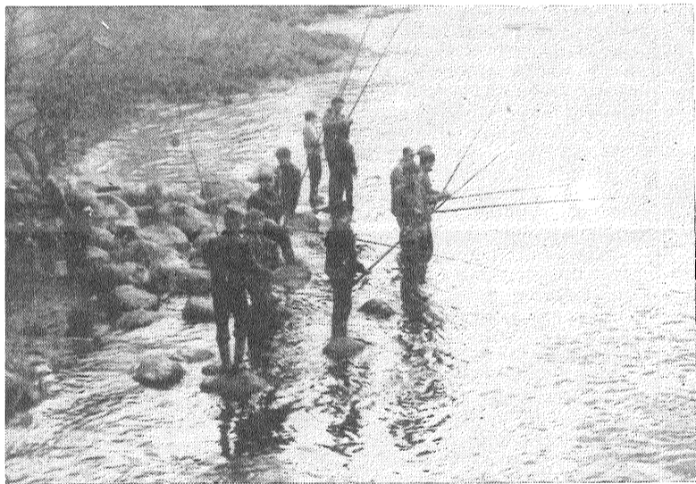
● Beldzot atrasta Ištā zivju vieta.