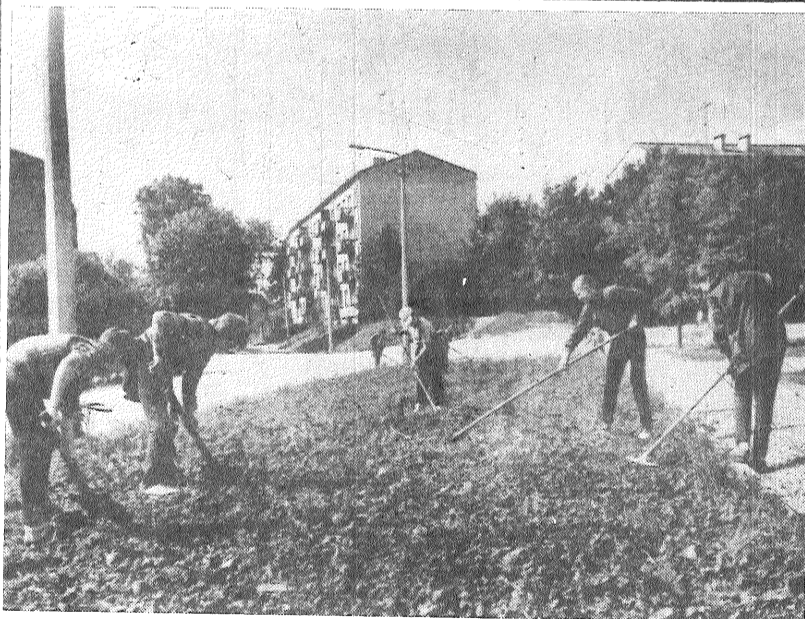
Preiļu ielās un skvēros izgājuši trīsdesmit Preiļu 1. vidusskolas piekto, sesto, septīto klašu lotosnieki. Viņi aplūdzina dzīvžogus, lēģi, Brīvības ielās, Raina bulvārī, stāda un kopj puķes, ierīko zālienu. ATTĒLĀ: zālāja ierīkošana pie Valsts rūpniecības apvienības «Latvijas siltums» Preiļu rajona katlu māju un siltumtīklu direkcijas jaunās kantora ēkas.