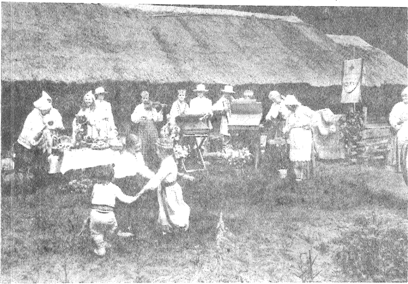
● Brīvdabas muzeja Latgāliešu sētā muzicē mūsu rajona folkloras ansamblis «Silava».