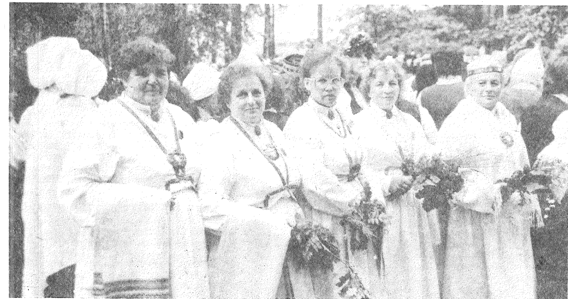
● Grupa mūsu rajona koristu neilgi pirms svētku koncerta.