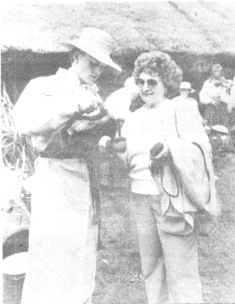
Ciemiņi garšoja līdzatvesto Latgales alu un sieru.