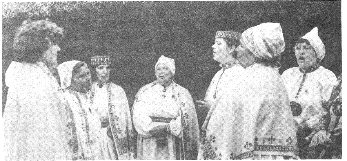
Dziedam kopā ar Beņislavas ansambli no Balvu rajona padomju saimniecības «Lazdukalns».