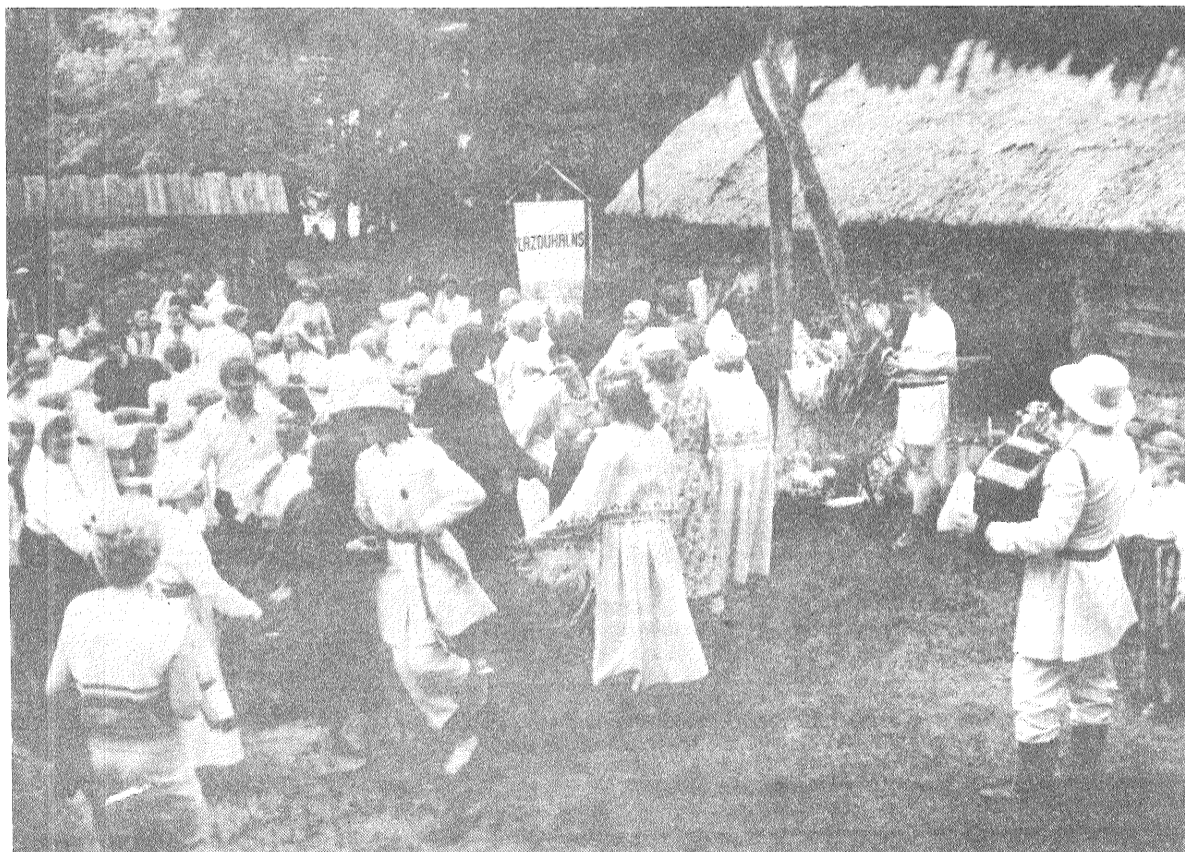
Kas gan vēl var būt jaukāks — dzīvespriecīgas rotājas un dejas īstu draugu pulkā!