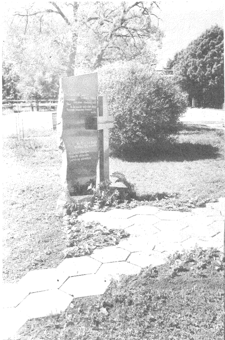
◆ Trimdā aizvesto latviešu piemiņai. Pieminēklis Līvānos.