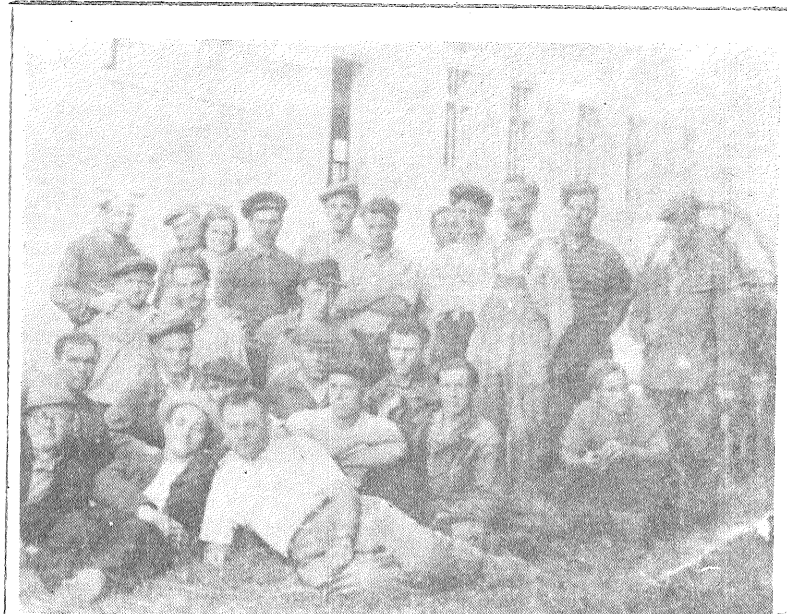
1959. gada maijs. Jaunās skolas celtnieki — vietējie Vanagu novada ļaudis.