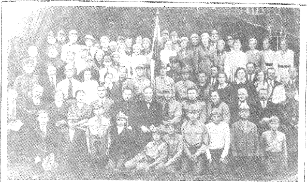
30. gadi. Vanagu skolas skolotāji un muziķi dalībnieki mazpulcēnu salidojuma.