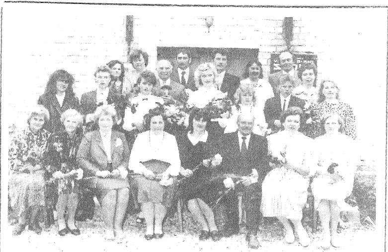
1990. gads. Skolotāju kolektīvs kopā ar Vanagu skolas šī gada absolventiem.

raiona kultūras nodalās vadītāja [Honorāru novēlu Vanagu skolai]