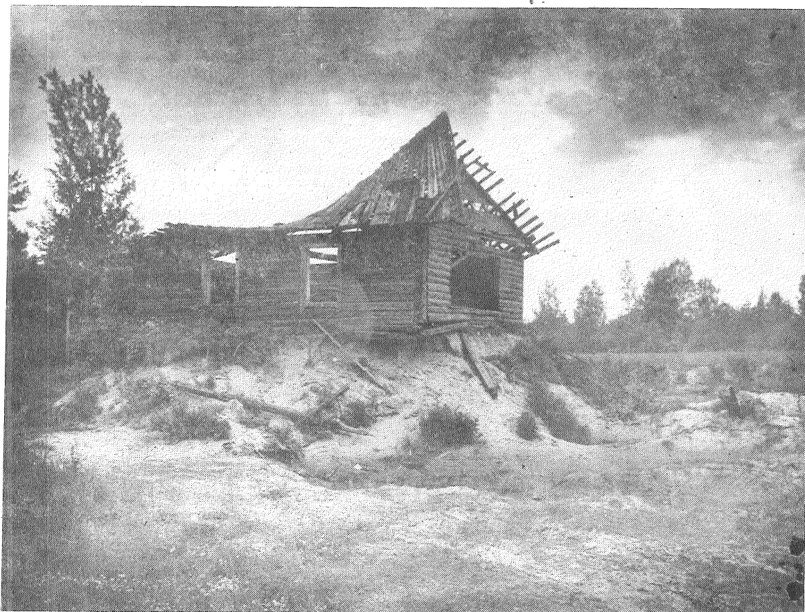
Arī mirušas mājas sūp mātei Latgalei...

Ikšķiles novada sporta biedrības valdes loceklis