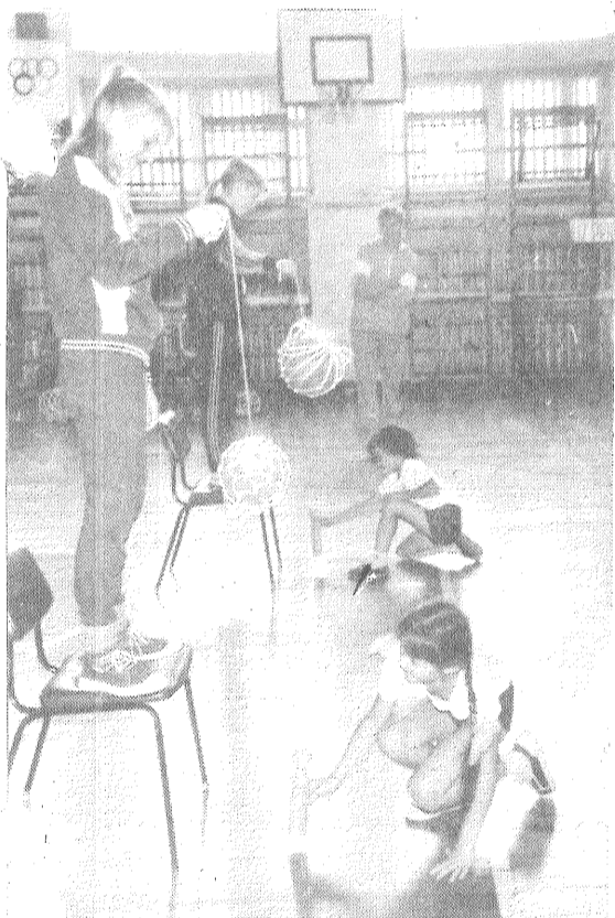
Tortes saņēma visi

rajona alternatīvā dienesta komisijas priekšsēdētājs