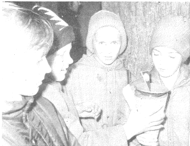
Dravnieku deviņgadīgās skolas meitenes priecājas par balvu.