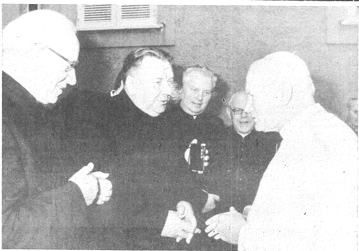
Jānis Pāvils II: