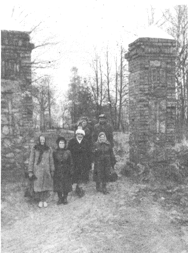
◆ Arī tie ir vienīgi no mūsu miesta vārdiem, «1900» — vēsta zīmes uz tiem.