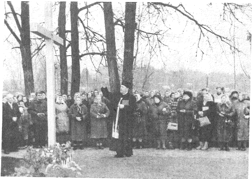
◆ Kapu krusts saņem svētību.

Uz daudzām kapu kopīnām dega sveces un galvas lieca mētiņprozes — izradās, tik daudzi te savus senču kapus atminēja. Un labi, ka vismaz tagad, ka vismaz šī gada 1. novembra vakars — visu ticīgo mirušo