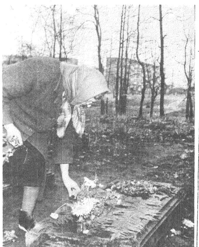
◆ Kapiem atgriezušies kopēji.