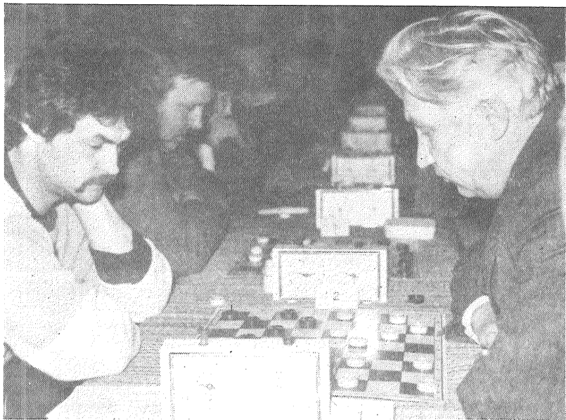
ATTELOS: galda tenisisti spēkojās sporta kluba «Cerība» sporta zālē; pie šaha galdiem.