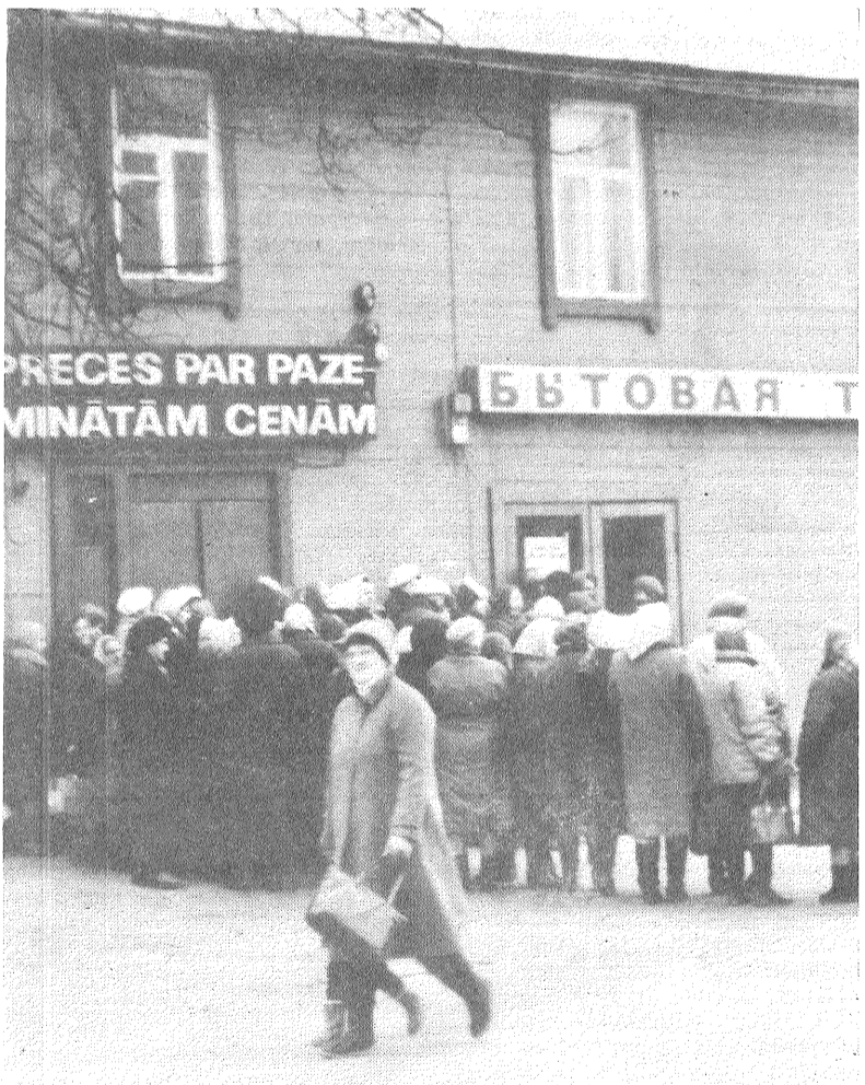
MŪSU PARASTĀ IKDIENA.