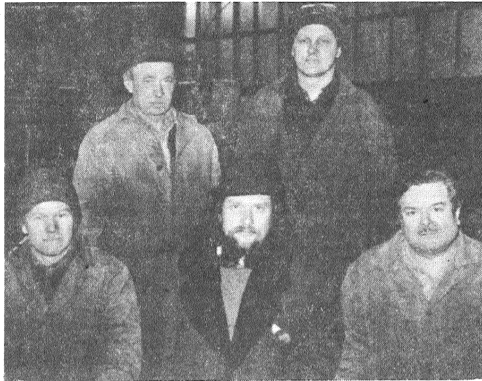
Ražošanas apvienības «Lauktechnika» traktoru un mašīnu tehnisko apkopju stacijas ļaudis izdara ne tikai tehniskās apkopes, bet uzsākuši arī jaunu agregātu izgatavošanu. Piemēram, aizvadītajā gadā izgatavoti 60 siena vālotāji «Jula». Saražoto tehniku tirgo paši, atbilstoši izejvielu un komplektējošo detaļu pieaugumam.

P.S. Patiesi demokrātiskā valstī pret presi nebūt neizturas tikai kā pret tirgus preci, bet apzinās arī tās kultūrvēsturisko un sabiedrības pašpārvaldes lomu. Tāpēc daudzās valstīs (Vācijā, Norvēģijā u.c.) nelielos, konkurētspējīgos izdevumus dotē vai nu valdība vai vietējā municipālitate, lai radītu preses daudzveidību un nodrošinātu visiem cilvēkiem vienādas iespējas brīvi paust savus uzskatus.