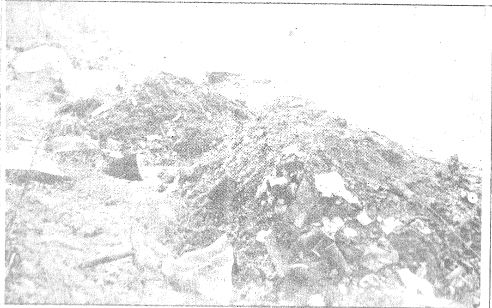
Ko tik cilvēki neizdara benzīna krīzes laikā! Lai taupītu dārgo degvienu, daži Līvānu rupnicu šoferi atkritumos vis neved uz patālo Steķu sīla izgāztuvi, bet tepat pie mājām — uz Daugavmalu. Attēlā redzami atkritumi, acīmredzot, vesti no kādas mehāniskās darbnīcas. Eļļas filtri, eļļainas lupatas, troses gali, metāla skaidas un uzgriežņi, asfalta gabali, stikla lauskas un ogļu izdedži... No šīm kaudzēm mazliet tālāk izgāzta autokrava neizlietota asfalta. Un tas viss — Daugavmalā, pārdesmit metrus no Līvānu pārceltnes.

P.S. Soda naudu iekasē uz vietas, atteikšanās gadījumā vainīgo nogādā uz policijas iecirkni, sastāda administratīvo protokolu, soda nauda tiek palielināta par 20 %. Soda naudu ir tiesīgi uzlikt: municipālās un valsts policijas darbinieki, zemessardzes patruljas, dzīvokļu un komunālās saimniecības atbildīgā amatpersona, rajona SES, rajona un pilsētas deputātu komisijas, pilsētas valde, ugunsdzēsības inspektori, valdes atbildīgie darbinieki, siltumtīklu un apvienoto katlu māju atbildīgās amatpersonas pēc pilsētas valdes saskaņota saraksta, ielu komiteju vecākie, māju vecākie. Soda naudas uzlikšana neatbrīvo no materiālo zaudējumu atlīdzināšanas.