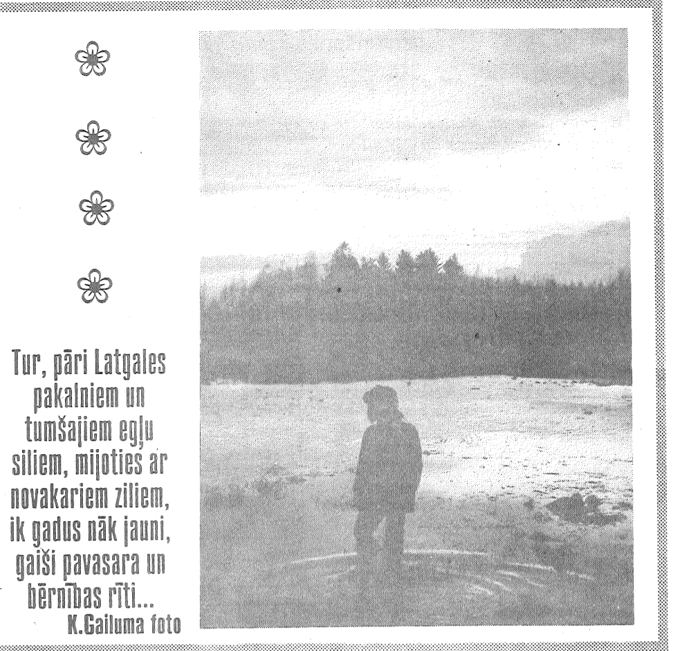
Tur, pāri Latgales pakalniem un tumšajiem egļu siliem, mīļoties ar novakariem ziliem, ik gadus nāk jauni, gaiši pavasara un bērntības rīti...