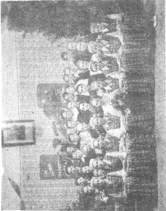
■ 50. gadu beigās izlaidumos absolventi bieži gērbās tautas tērpos. Vecākie un visu saprotošie skolotāji arī tādā veidā apmulsušajos padsmītniekos palīdzēja saglabāt imunitāti pret tā tēvoča idejām, kura portrets redzams pie sienas. Attēlā 1957. gada absolventi.

Skolēnu skaitam pieaugot, bija nepieciešama lielāka sko-las ēka. 1930. gada rudenī veco Jezuīnovas skolu, bijušo muižas kalpu ēku nojauc un tās materiālus pārdeva uz Jas-muižu jaunas skolas ēkas būvei. Tā ilga no 1930. gada oktobra līdz 1934. gada oktobrim un izmaksāja 2300 latu. Divstāvu skolas ēkas būvē bija izlietots gan vecs, gan jauns materiāls. Apakšējā stāvā izvietojta trīs klašu telpas un ar izņemamu sienu pārdalītu zāli — kopā piecas klašu telpas. Augšējā