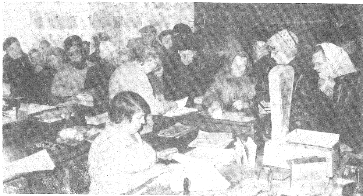
19. novembrī Preiļu pasta...

Ja cilvēks redz, kā nepārtraukti pieaug preču un pakalpojumu cenas, viņš to vēl pacieš, bet, ja atņem pēdējo, tad cilvēku pārņem izmisums. Tieši tādā neapšaubāmā situācijā nokļuva pensionāri, jo pensiju izmaksāšana kopš 7. novembra nenotika. Tās sāka izmaksāt tikai 19. novembrī. Ļoti nepatīkamus brīžus nācās pārdzīvot pasta darbiniekiem, lai gan viņi nebija vainīgi. Preiļu pasta direktors