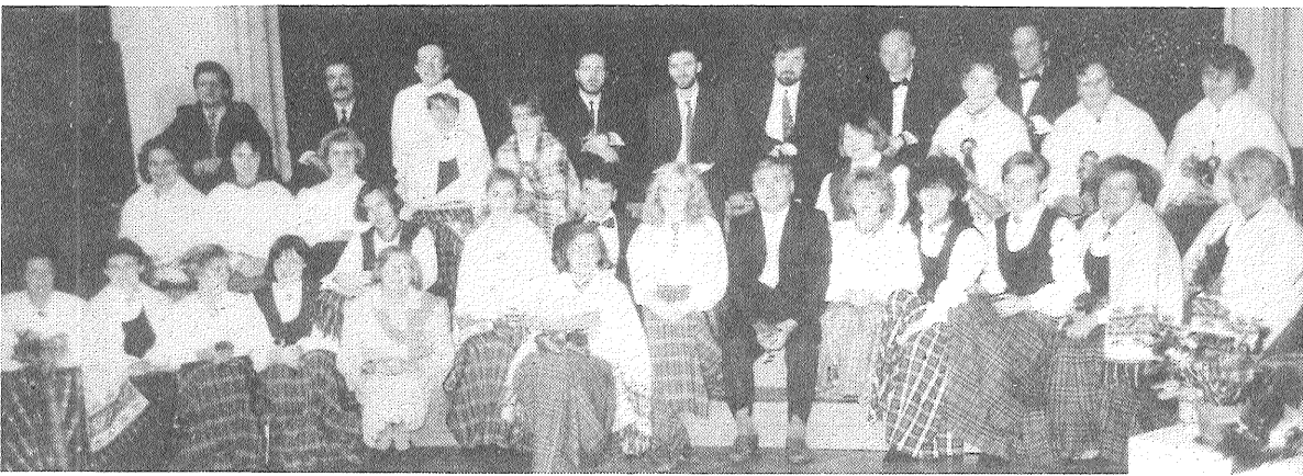
■ Sestdien Preiļu rajona skolotāju koris atskatījās uz savas darbības 20 gadiem. Kultūras nama zālē notika plašs koncerts. Sumināja kora dirigentus, ilggadīgos dziedātājus.