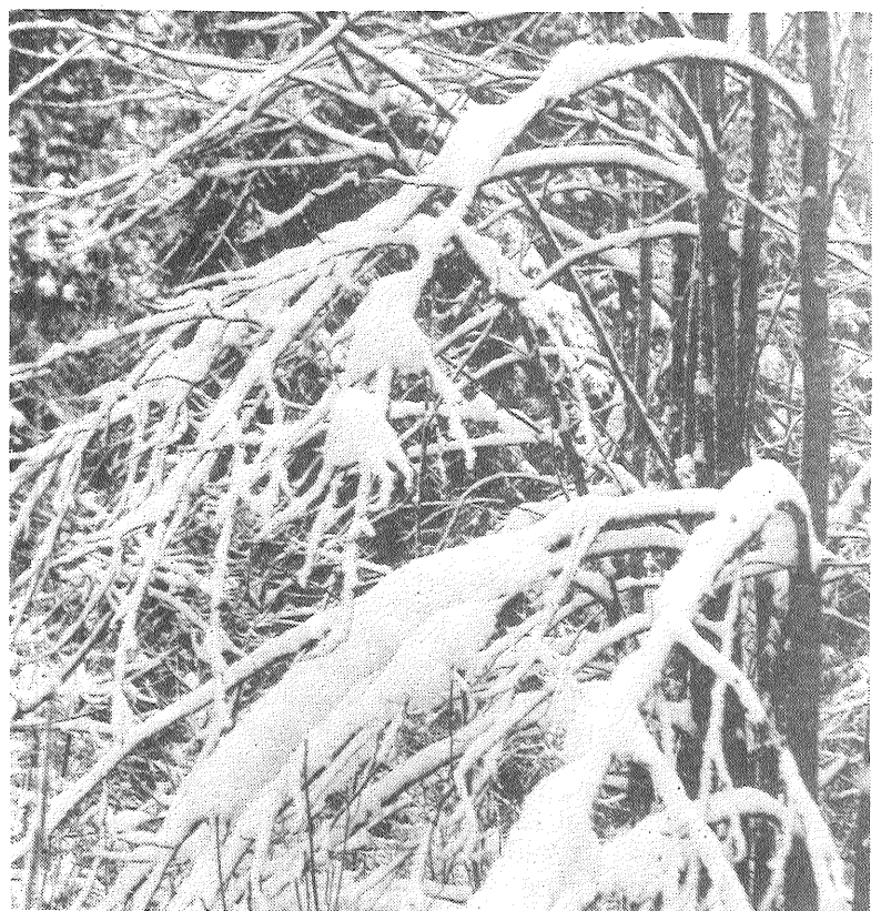
■ Vecais bērzs ziemas rotā.